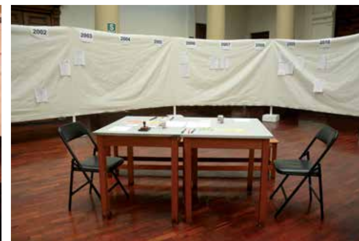
(re) Acciones Públicas. Intervenciones, activismos y ocupaciones: centro histórico de Lima, 1992-2016. Detalle de mesa y banderola.