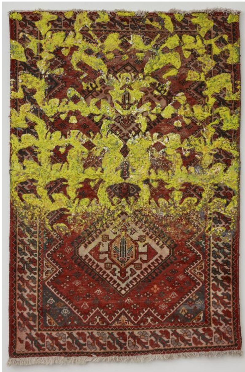
Marco Pando, Animated syncretic shadow II, 2022. Cera sobre alforja montada sobre madera en estructura metálica, 144 x 129 cm.

Tanto el textil para prendas de vestuario como las alfombras y los objetos utilitarios -inicialmente desarrollados por las tribus nómades como protección- le plantean al artista, desde la materialidad y función del objeto conocido, la búsqueda de otras capas de significado posibles a partir de la obliteración y la intervención, para indagar en el posible reencantamiento mágico del objeto encontrado en el mar genérico de la producción masiva industrial. Y esto parecería -también- un comentario comprensible por museos (no exentos de piezas provenientes de expolios) tan minuciosamente enciclopédicos como el del Louvre, en los que Pando confronta su condición no europea, verificando la acumulación material de las otrora potencias coloniales -esta última, convertida en materia prima de la oferta turística de la que la ciudad capitaliza.