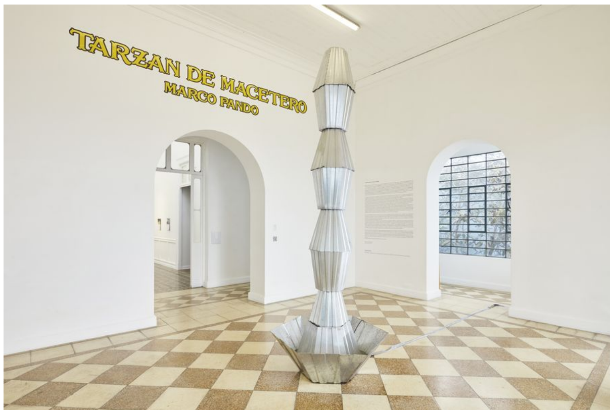
Marco Pando, Brancusi Fountain, 2022. Plancha de zinc, bomba eléctrica para agua, 420 x 100 cm aprox.

Esta recreación puede experimentarse en una proyección de video, así como en fotografías en un calendario de pared de edición limitada del año 2023. La elección del calendario es un guiño a la forma en que la gráfica aplicada en los siglos XIX y XX ha portado visualidades romantizadas (como paisajes ya urbanos o rurales europeos) hasta los confines de los países del sur global, desde un elemento utilitario cotidiano, permitiendo sublimar exotismos y confirmando sus auras de poder simbólico.