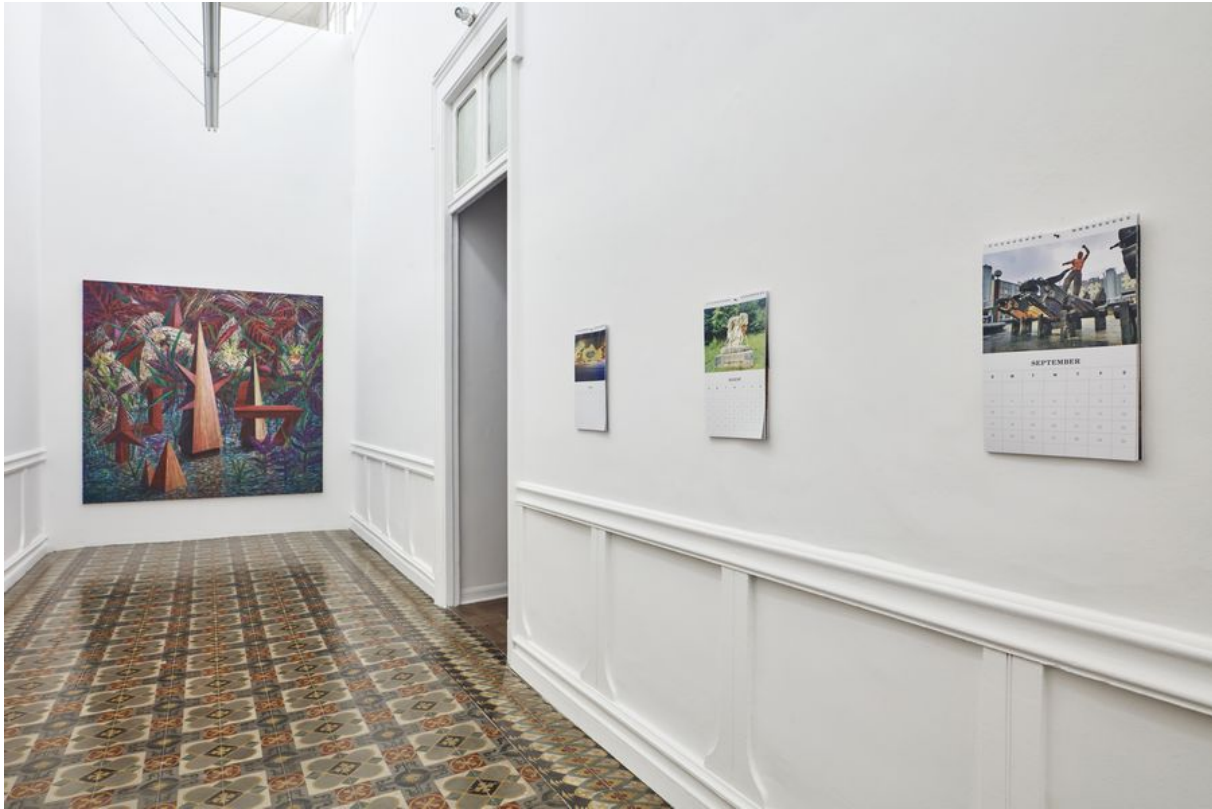
Vista de la exposición "Tarzán de maceterero", de Marco Pando, en 80m2 Livia Benavides, Lima, 2022.