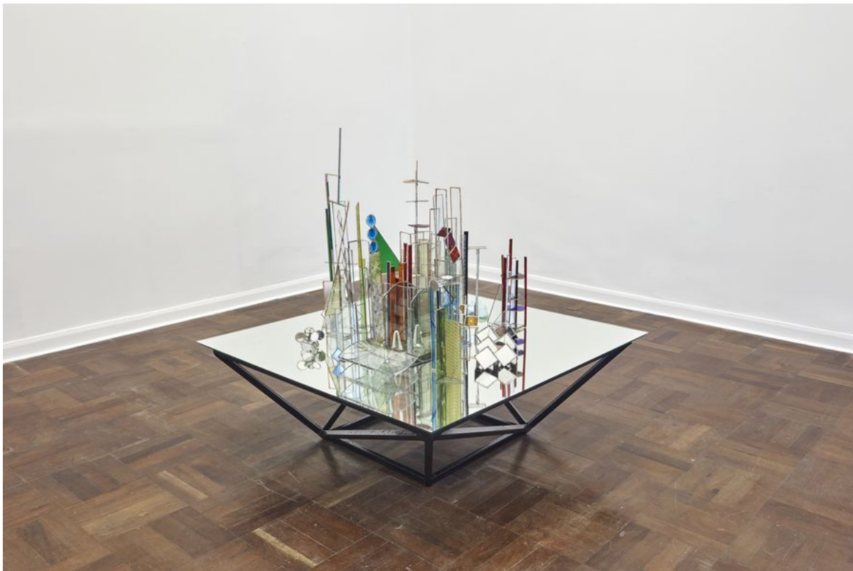
Marco Pando, How to erase language with invasive plants after the Bauhaus, 2018. Vidrio, plomo, espejo y hierro, 100 x 100 x 100 cm aprox.