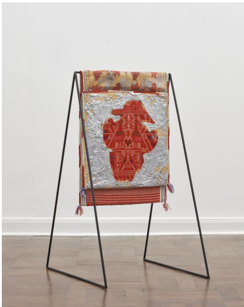
Marco Pando, Alforja, 2022. Cera sobre alforja montada sobre madera en estructura metálica, 50 x 45 cm (alforja); 90 x 50 cm (estructura metálica).