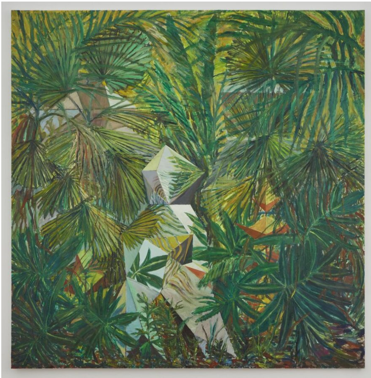
Marco Pando, Exótica Invasiva: Ulex Europaeus, 2022. Óleo sobre tela, 198 x 195 cm.