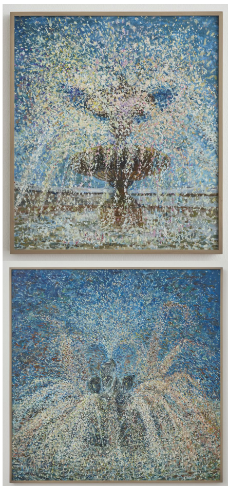
Marco Pando, Fountain water monsters, 2021. Óleo sobre madera.

Por otro lado, cera y pigmento dialogan con el textil sobre objetos utilitarios (puerta de refrigerador y alforja, por ejemplo) desde la materia prima no cubierta: estéticas de reapropiación, pero también de reciclaje, como testimonios de transformaciones inesperadas para nuevos posibles roles -pero inesperados- que nos mantienen en una conexión con el esquema del museo antropológico ortodoxo de origen colonial, donde los objetos cotidianos de "culturas no occidentales" son mostrados como testimonios de un pasado distante supuestamente pre-tecnológico, pre-moderno.